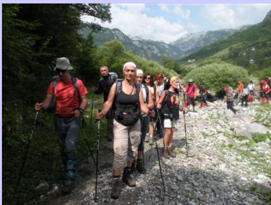
ulaz u kanjon Mrtvice iz Velje Dubokog

Od ovog sela započinje kanjon reke Mrtvice. U ovom početnom delu nema vode. Staza je vidljiva i delimično zarasla. Krenuli smo desnom stranom reke Mrtvice. Nakon dva kilometra prelazimo na desnu stranu kanjona. Očekivali smo veliku vodu a dočekao nas je suvi potok. Desnom stranom smo prošli kroz kanjon sve do njegovog kraja.