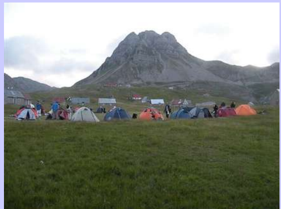
kamp ispod Malog Žurima

Prvi mrak nas je naterao na spavanje. Jedna neprospavana noć i naporan dan su nas savladali. Sutradan rano ustajemo, pakujemo šatore i prevozom dolazimo do novosagrađene crkve. Malo smo uštedeli na vremenu. Brzo smo se odvojili od makadama a onda kaljaviim putem zaobilazimo Stožac. Stalno silazimo, nekad strmije, a nekad po ravnom putu, sve do zaseoka Velje Duboko. Više od pola sata smo se sačekivali.