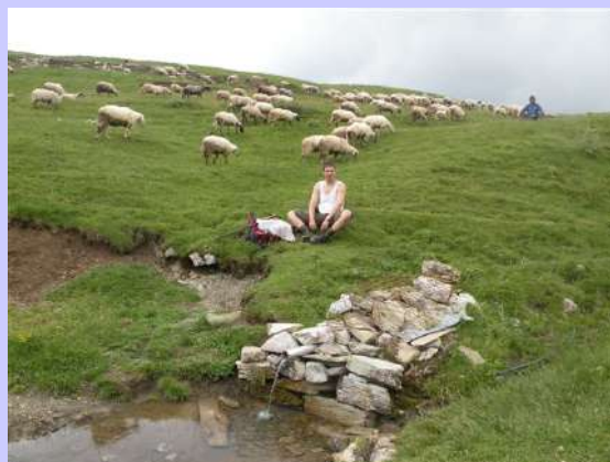
izvor kraj Kapetanovog jezera

Dvumimo se - da li napred ili nazad... Ipak polovina grupe kreće ka najvišem vrhu. Rastali smo se na prevoju. Lastva je, sa južne strane, jedno veliko zeleno brdo. Desno od Lastve su strme stene Zgradca. Zatrvljenim policama, nakon dve doline, uđosmo u onu pravu. Izabrali smo jedan sipar koji nas dovede do glavnog grebena Lastve. Na vrhu nas dočeka magla koja se povremeno udaljavala i ponovo vraćala na vrh. Koristimo vedre intervale za slikanje i ponovo ka prevoju.