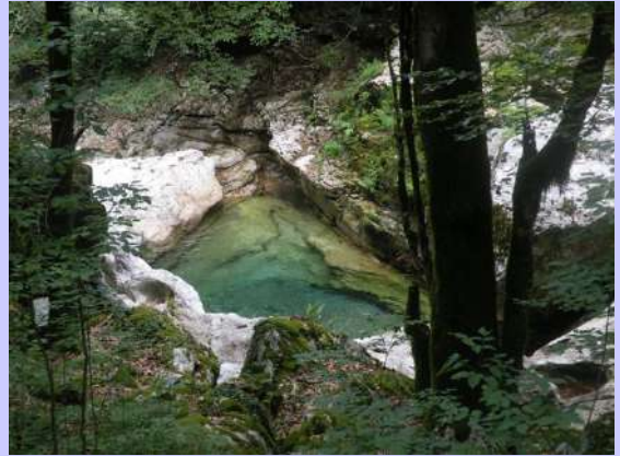
kada za kupanje