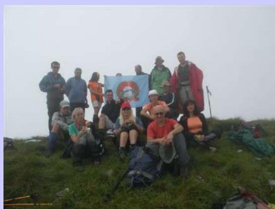
grupa na Lastvi (2226m)