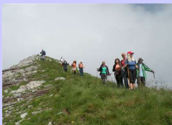
silazak sa vrha