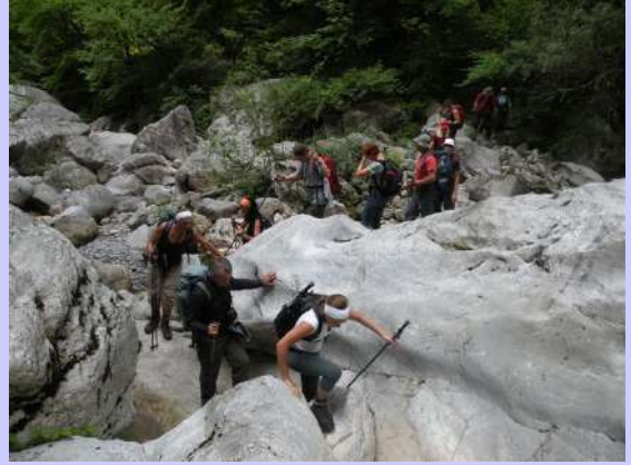
prelaz preko Mrtvice

Velika vlažnost u kanjonu nam nije prčinila bliski susret sa najavljivanim gmizavcima. Ne žurimo, razgledamo strme litice koje su se zarile u nebo. Pojavila se i voda u predivno isklesanim kamenim kadama. Kada smo se približili reci, noge su same došle do vode.