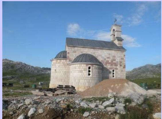
nova crkva na Barama Bojovića

Prvi mrak nas je naterao na spavanje. Jedna neprospavana noć i naporan dan su nas savladali. Sutradan rano ustajemo, pakujemo šatore i prevozom dolazimo do novosagrađene crkve. Malo smo uštedeli na vremenu. Brzo smo se odvojili od makadama a onda kaljaviim putem zaobilazimo Stožac. Stalno silazimo, nekad strmije, a nekad po ravnom putu, sve do zaseoka Velje Duboko. Više od pola sata smo se sačekivali.