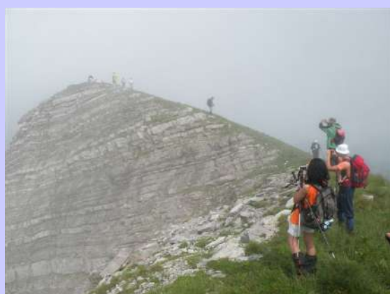
pogled na Lastvu